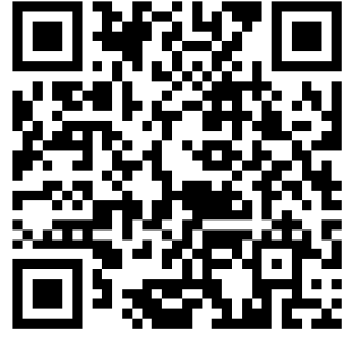
银行服务事项清单